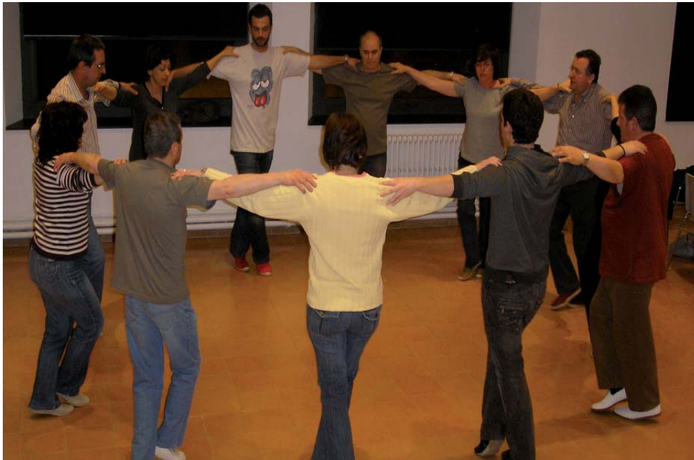
Bona part del grup que forma la nova colla veterana, en un assaig al Seminari de Vic

Van començar acompanyant els seus fills als concursos de sardanes i han acabat essent ells els que es preparen per fer el galop d'entrada i ballar les sardanes de lluïment. Són una colla de pares i mares dels dansaires del Grup Riallera que, després d'un temps de donar-hi voltes, aquesta temporada han decidit formar una colla veterana i passar a ser, també ells, balladors de competició.